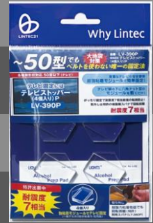
こんなテレビ脚と脚裏でも